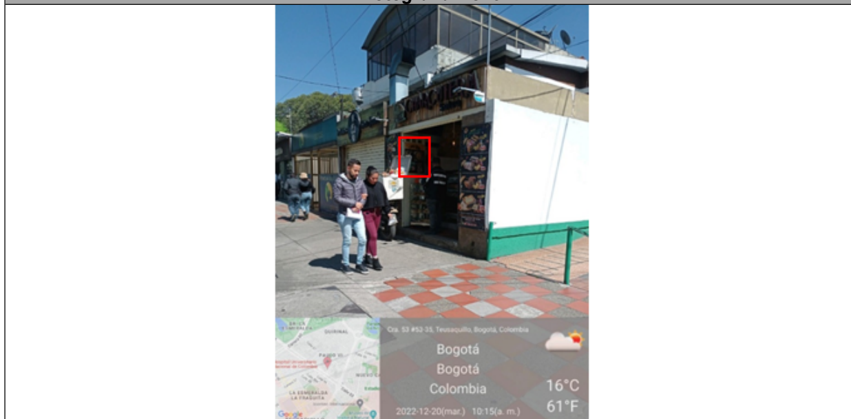
Fotografía panorámica del establecimiento en la cual se evidencia un (1) elemento de Publicidad exterior visual en puertas adicional al elemento en puerta de la fotografía No. 2