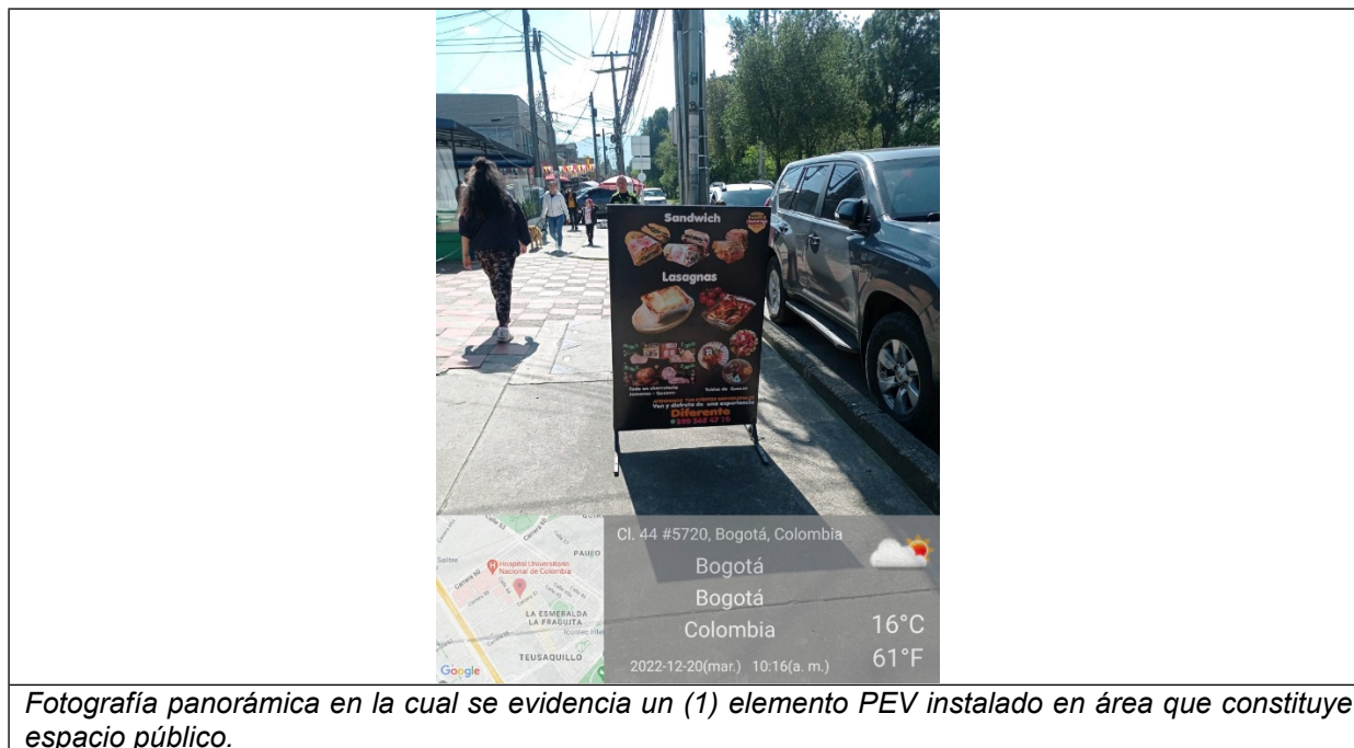
Fotografía panorámica en la cual se evidencia un (1) elemento PEV instalado en área que constituye espacio público.